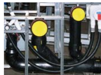
Komplette Sanitär-Installation inkl. kompakter Verrohrung