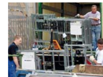
Kompetente Vorfabrikation, hohe Verfügbarkeit, rasche Lieferung