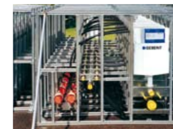
Kurze Bauzeit dank serieller Vorfertigung