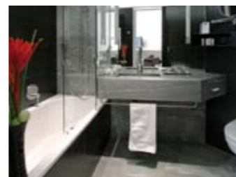
Auch für komplexe Anforderungen; passgenau und sicher