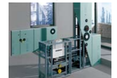
Universell einsetzbar, montagefreundlich und flexibel für Veränderungen