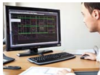
Für jedes SV-Element erstellen wir einen detaillierten Installationsplan