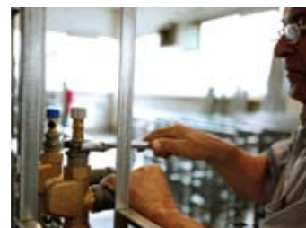
Termingerechte und qualitativ hochstehende Ausführung dank kompetentem Fachpersonal